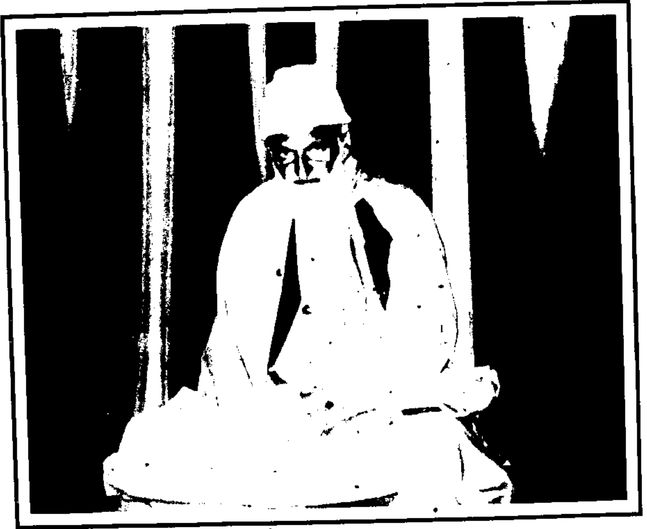
حضرت خواجہ غلام فخر الدین سیالوی رحمتہ اللہ علیہ